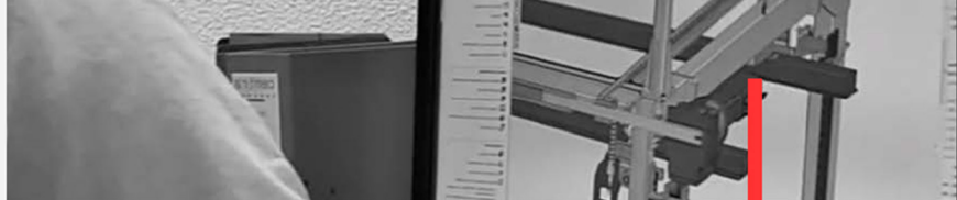
Table d'introduction sur ligne continue